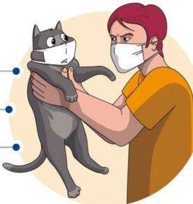
Рисунок 3 – Заходи безпеки від COVID-19 при контакті з тваринами.

3 ЦЕ УБЕРЕЖЕ ВАС ВІД ТАКИХ БАКТЕРІЙ, ЯК КИШКОВА ПАЛИЧКА ЧИ САЛЬМОНЕЛА, ЩО МОЖУТЬ ПЕРЕДАВАТИСЯ ВІД ДОМАШНІХ ТВАРИН ЛЮДЯМ