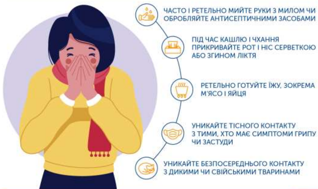
Рисунок 1 – Заходи обережності, щодо недопущення розповсюдження COVID-19.